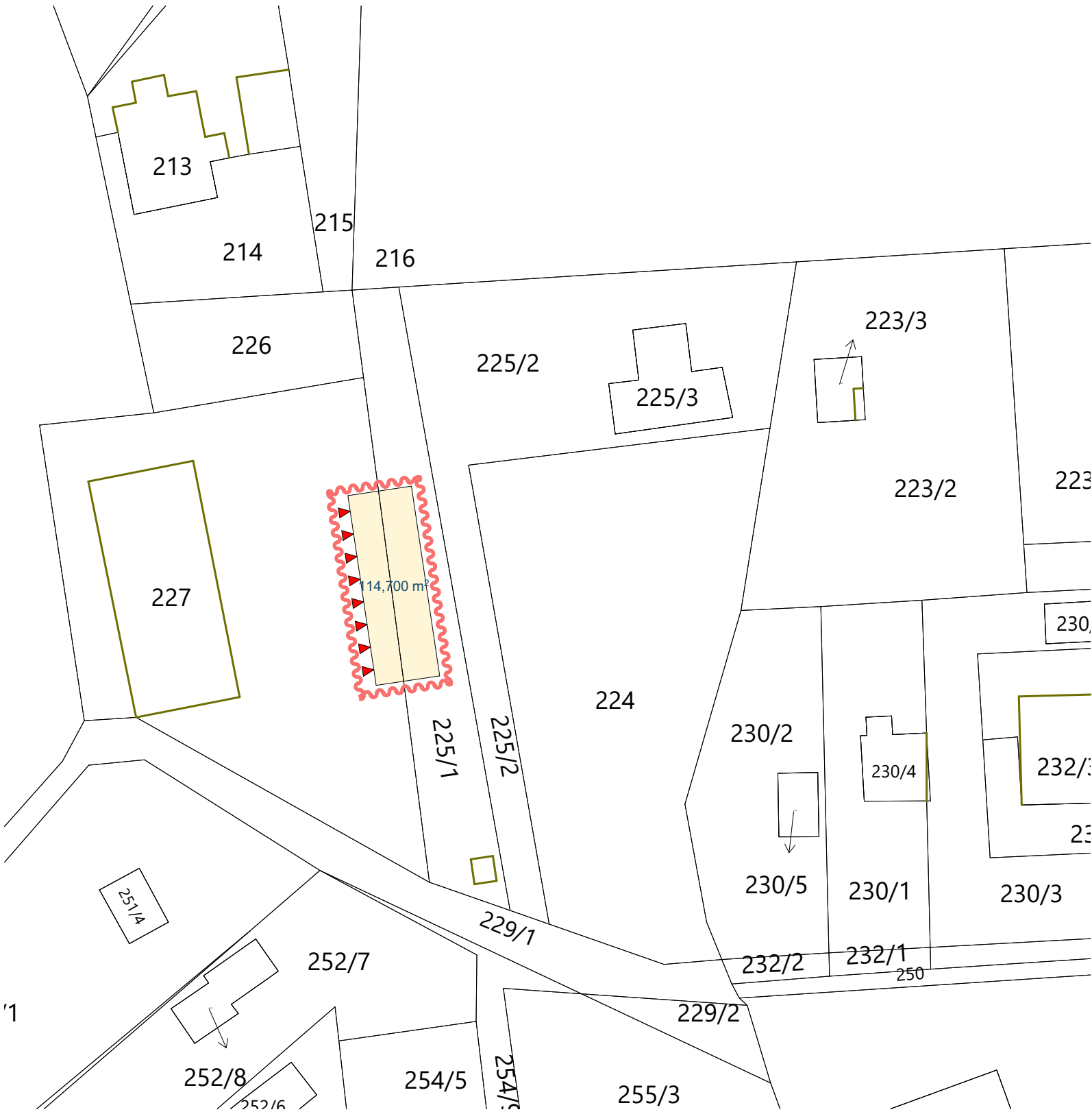
Situace - katastrální 1:500